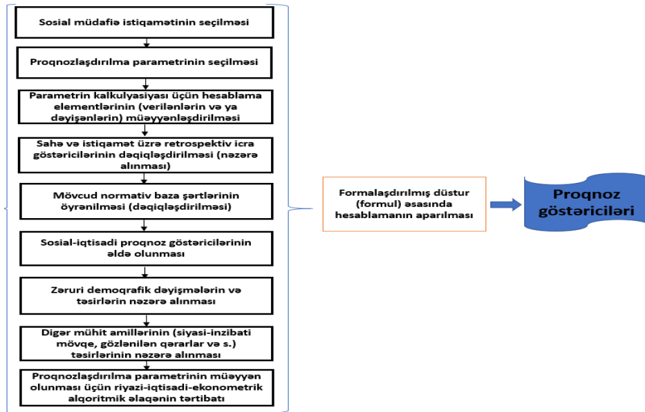
Şəkil 1. Sosial müdafiədə proqnozlaşdırılma prosesinin konseptual təsviri (müəllif tərəfindən tərtib edilmişdir)

Bütövlükdə sosial müdafiə sahəsinin tərkib strukturu nəzərə alınmaqla sosial müdafiənin proqnozlaşdırılmasının amilləri mühitini aşağıdakı sxematik təsvirlə vermək mümkündür (şəkil 1):