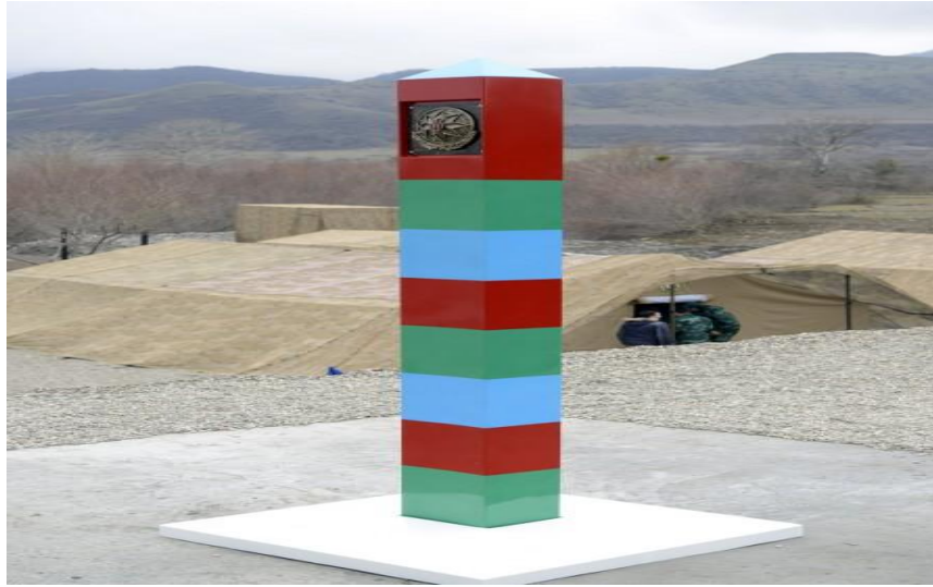
Şəkil 2. Azərbaycan-Rusiya dövlət sərhədində qurulan sərhəd nişanı

Hər iki dövlət sərhədi şəffaf sərhəd hesab olunur. Xırda sərhəd insidentlərini nəzərə almasaq, Rusiya ilə olan dövlət sərhədlərində ciddi münaqişəli vəziyyət müşahidə olunmur. Hər iki ölkənin Xəzərdə və quru sərhədlərində ortaq təhlükəsizlik maraqları, o cümlədən transsərhəd cinayətlərinə qarşı mübarizə aparmaq istəyi sərhəd mühafizəsi sahəsində birgə əməkdaşlığını zəruri edir. Xüsusən də, Şimali Qafqazda ayrı-ayrı dini, ekstremist qruplaşmaların tez-tez baş qaldırması və onların təsirinin Azərbaycana sirayət etməsi ehtimalı dövlət sərhədlərinin mühafizəsinin koordinasiya şəkildə təşkilini zəruri edir [4, s.42].